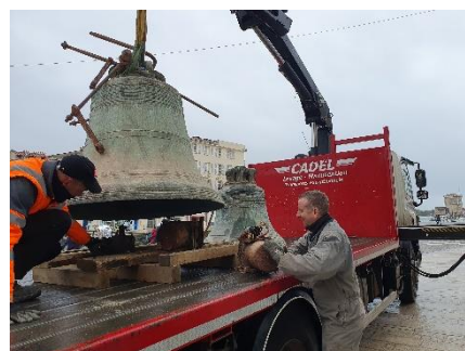
Départ des cloches de Saint-Sauveur, décembre 2022.

Le clocher a subi d'importantes dégradations dues à la salinité remontant du sol ainsi qu'à l'érosion provoquée par l'environnement marin. Face à ces dégradations, la Ville de La Rochelle a pris la décision de rénover ce dernier. Le projet a débuté en 2020 par la sécurisation du clocher et l'installation de filets pour empêcher la chute des pierres sur la voie publique. La restauration du clocher et du beffroi a été l'occasion de restaurer les cloches et leur mécanisme.