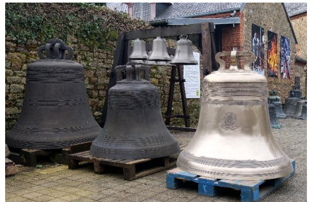
Les cloches Gabrielle-Paule, Victoire-Louise et Victoire Louise-Rochelle à la fonderie Cornille-Havard.

Ces cloches vont rejoindre le patrimoine campanaire de la ville s'ajoutant aux cloches laïques (Hôtel de Ville et de la Grosse Horloge) et religieuses (église Notre-Dame, Cathédrale Saint-Louis, Fétilly et la Genette).