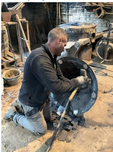
Fabrication d'une cloche, fonderie Cornille-Havard.

L'église Saint-Sauveur va accueillir cinq cloches, dont trois appartiennent à la Ville de La Rochelle et deux réalisées à l'initiative de Salvare Campani avec l'intervention de deux artistes Rochelais.