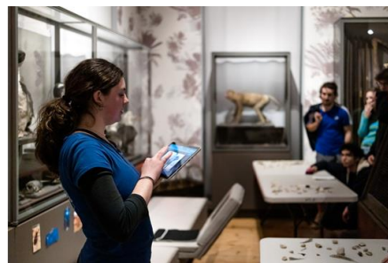
Musée Maritime La Rochelle / Musée du Nouveau Monde / Muséum d'Histoire naturelle La Rochelle