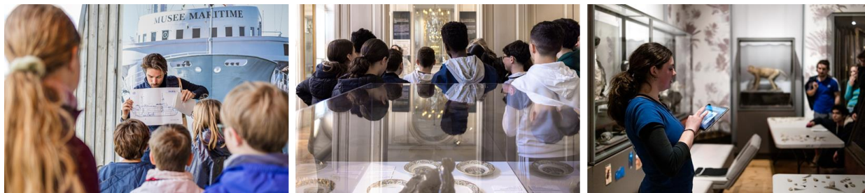
Musée Maritime La Rochelle / Musée du Nouveau Monde / Muséum d'Histoire naturelle La Rochelle