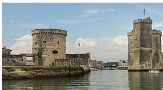
Les tours du Vieux-Port de La Rochelle.