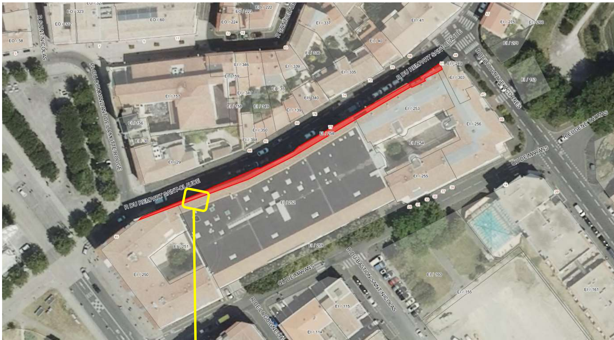
Zone des travaux

Envoyé en préfecture le 24/11/2022 Reçu en préfecture le 24/11/2022 Publié le 24/11/2022 ID : 017-211703004-20221124-DCM141122_36-DE