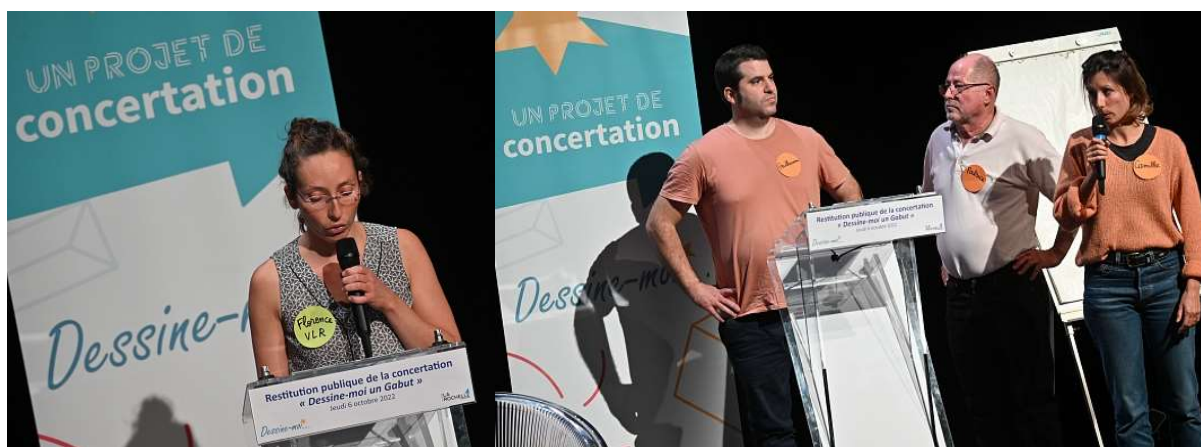
De gauche à droite : restitution des résultats de l'enquête sur les activités estivales par la Ville ; présentation de la proposition citoyenne par les représentants du groupe citoyen.

L'ensemble des supports présentés lors de cette restitution publique est disponible sur la page dédiée : https://dessinemoiungabut.larochelle.fr/