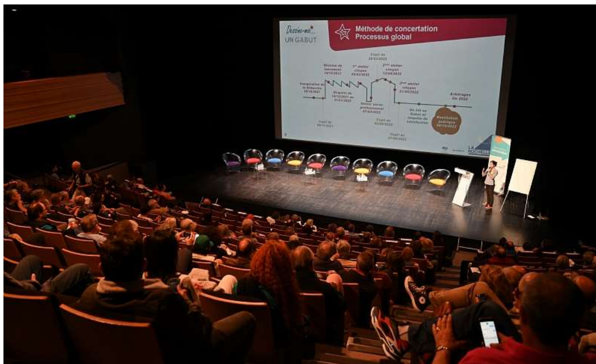
Présentation de la méthode de concertation par Lisode.

Théâtre Verdière de La Coursive, La Rochelle - 18h à 20h