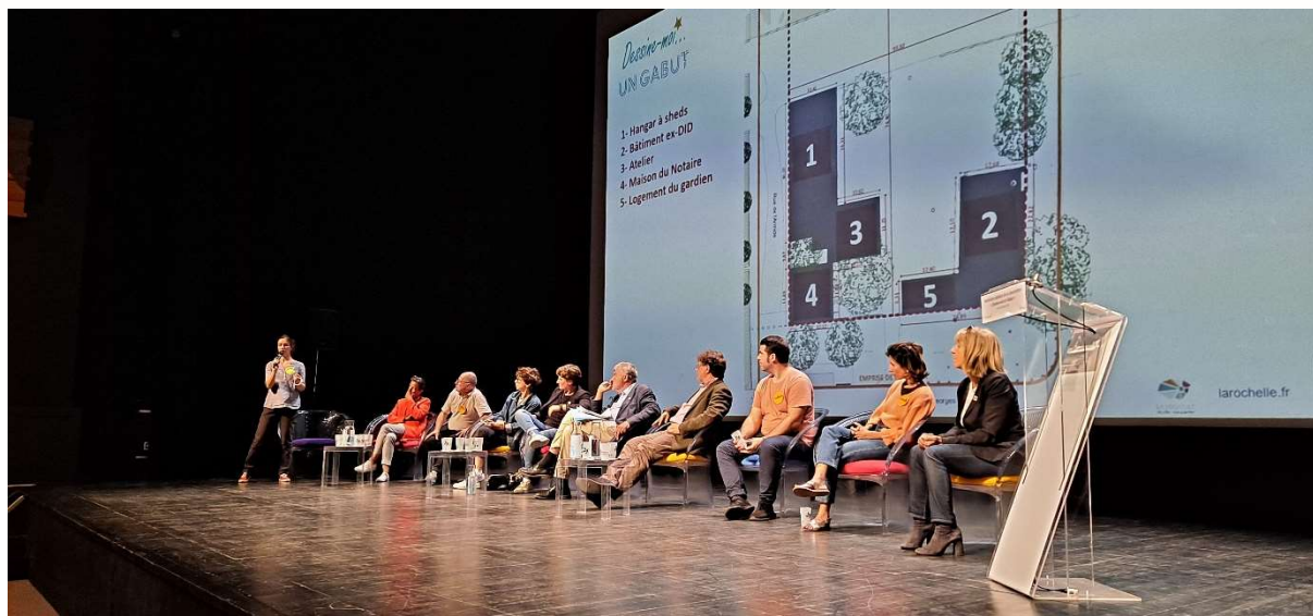
Les élus de la Ville et les représentants du groupe citoyen pendant le temps d'échanges avec le public.

Nous retranscrivons ci-dessous le contenu des échanges.