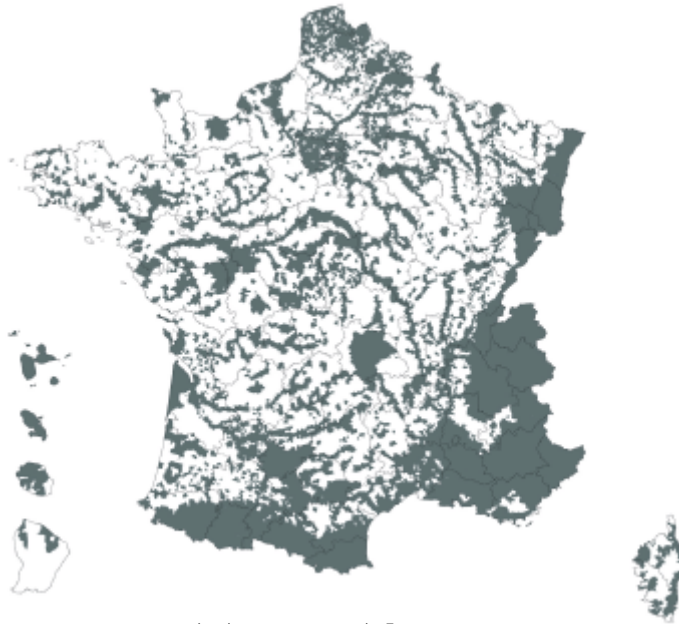
carte des communes de France où s'applique l'obligation d'établir un état des risques