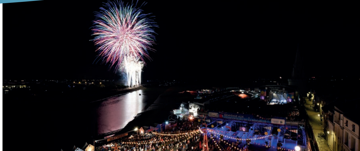
Retour sur le feu d'artifice sonorisé du 14 Juillet