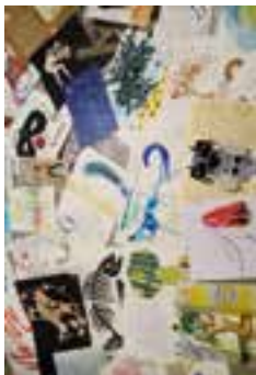
Livre pauvre © RÉ-CREATION