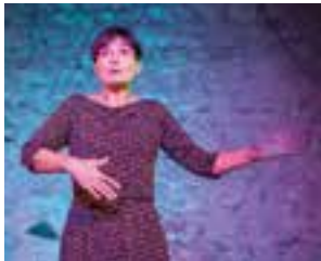
Dancing Fairies