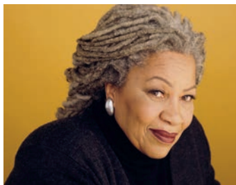
Toni Morrison