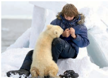
Pizou l'ours blanc